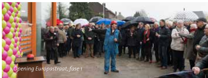
Opening Europastraat, fase 1