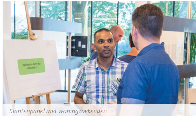
Klantenpanel met woningzoekenden